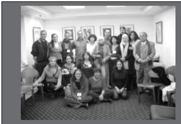
פרויקט סטודנטים ישראלים ופלסטינים לפיתוח מודל עבודה עם ילדים נפגעי טראומה בשיתוף עם מרכז פרס (GCMHP Gaza Community Mental Health Program) ובמימון ממשלת דנמרק.