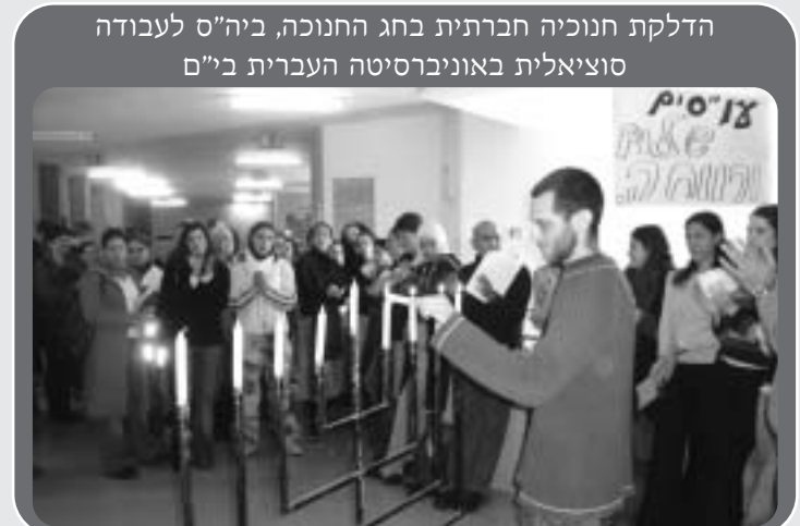
הדלקת חנוכיה חברתית בחג החנוכה, ביה"ס לעבודה סוציאלית באוניברסיטה העברית ב"ם