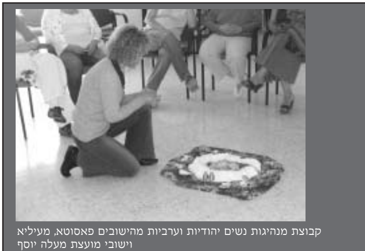
קבוצת מנהיגות נשים יהודיות וערביות מהישובים פאסטא, מעיליא וישובי מועצת מעלה יוסף

ברוכת ילדים, אם יוצרים אווירה חינוכית וטיפולית מתאימה. שני בני-הזוג מתפקדים כ"הורים" של כל הילדים. האב כמדריך חינוכי בחצי משרה, משמש בין היתר כמודל לחיקוי של דמות אב היוצא לעבודה מחוץ לבית בבוקר וחוזר אחר"צ.