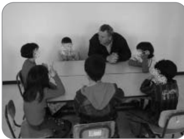
עוזרים לילדים בשיעורי בית

כפר יאסיף- תוכנית לימודים להעברת ידע לדורות הצעירים על הקהילה. ישתתפו בכתיבתה מורים ומומחי תוכן מבני הקהילה בשיתוף פעולה עם משרד החינוך. תוכנית לימודים זו תותאם לכל מערכי הגיל.